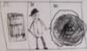
Handwritten caption below the diagram, possibly describing the objects or the person.