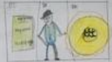
Handwritten caption below the diagram, possibly describing the objects or the person.

Handwritten notes in a box, possibly a list or a set of instructions. The text is dense and difficult to read due to the handwriting.